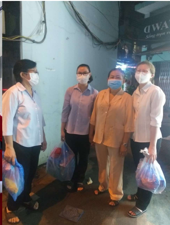
Cùng nhà dòng giúp đỡ các cô giáo mầm non và phát quà Giáng sinh cho người nghèo.