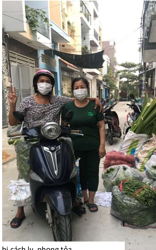
Chở gạo và rau củ cho khu vực bị cách ly, phong tỏa